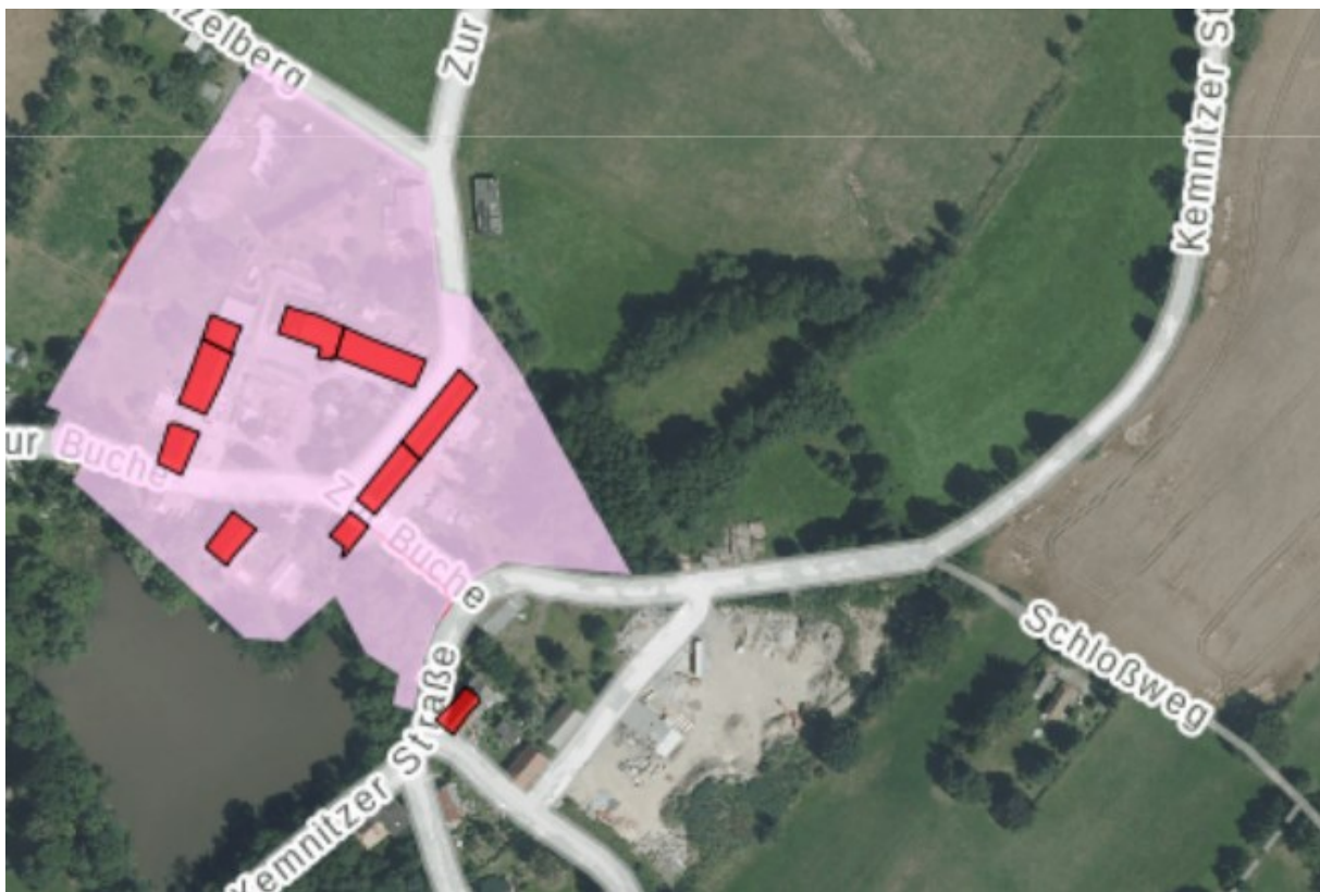
Abbildung 6: Kulturdenkmale im Umfeld des Plangebietes

Westlich des Plangebietes befindet sich das Kulturdenkmal „Wohnhaus eines Dreiseithofes“. Des Weiteren befindet sich nordwestlich der Kemnitzer Straße das Kulturdenkmal „Sachgesamtheit Rittergut Oberstrahwalde mit Einzeldenkmalen“.