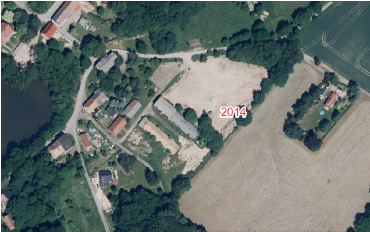
Abbildung 4: Landwirtschaftlicher Betriebsstandort, ehemalige LPG (Luftbild 2014)

Nachfolgend wurden die ehemaligen Stallgebäude durch die Firma Schuck-Bau fast vollständig zurückgebaut und die Grundflächen entsiegelt. Im Zuge dieser Maßnahmen und weiterer Beräumungen wurden auch Gehölzbestände entfernt (siehe Abb. 2 und Anlage 1 zum Umweltbericht).