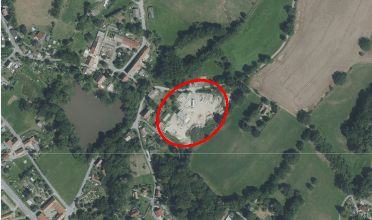
Abbildung 2: Lage des Plangebietes im näheren Umfeld (Luftbild 2020)