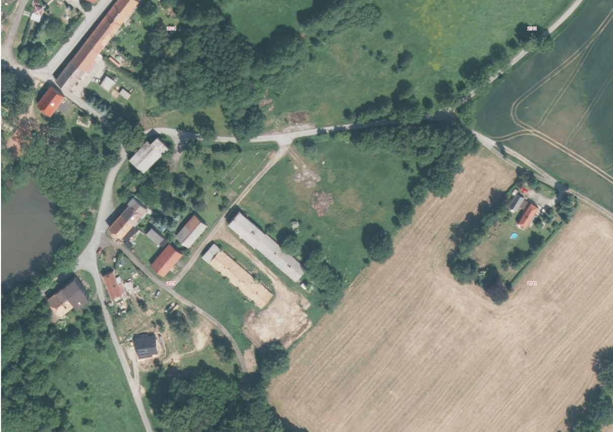
Abbildung 3: Landwirtschaftlicher Betriebsstandort, ehemalige LPG (Luftbild 2011)