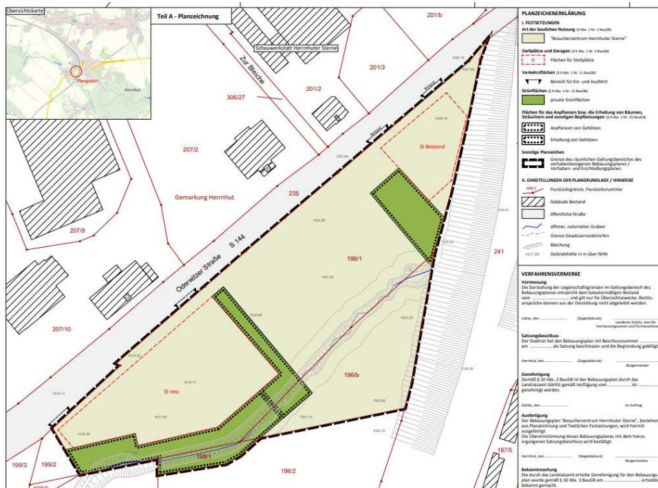
Planungsunterlagen Teil A - Planzeichnung

Grün: Waldflächen im Bereich des Eisenbahn-Viaduktes (Flurstück 241)