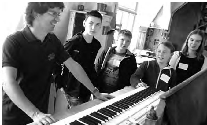
Wusstest du, dass in Löbau Klaviere gebaut werden? Wir schauten Tischlern und Klavierbauern der Firma August Förster über die Schulter und sahen zu, wie die großartigen Instrumente Schritt für Schritt in Handarbeit gebaut werden.