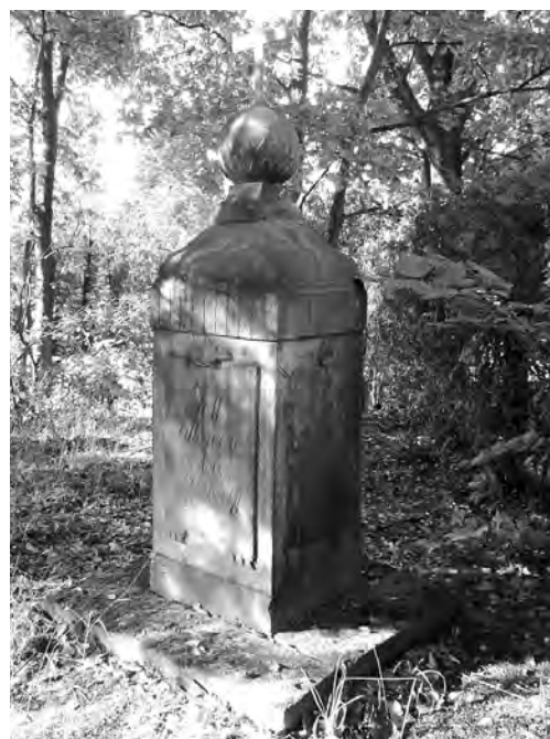
Das Foto zeigt: Lutherstein, Friedhof Ruppersdorf Von den Einwohnern zu Ruppersdorf, 31. Oktober 1817: »Dem Andenken der durch Gottes Gnade vor 300 Jahren d. D. M. Luther bewirkten Reformation gewidmet.«