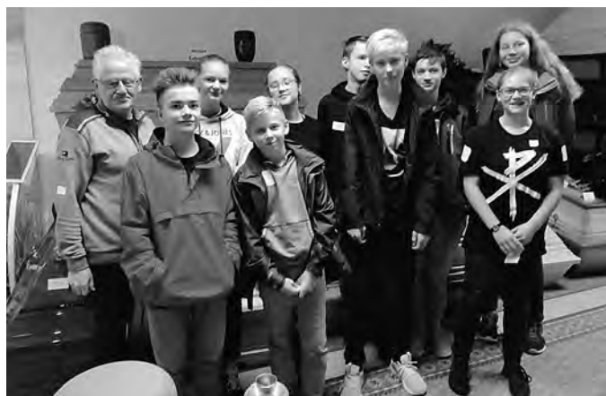
Tabuthema Tod. Auch der Tod gehört zum Leben. In diesem Workshop der Familie Großer konnte gefragt werden, was Schülerinnen und Schüler schon immer über dieses Thema wissen wollten.

Dies ist wirklich nur ein kleiner Auszug aus den tollen Angeboten des Evangelischen Schultages 2019.