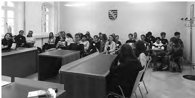
Hinter Gitter? – Amtsgericht Löbau. Was passiert bei einer Gerichtsverhandlung? Wer bestimmt mit, ob jemand verurteilt wird?