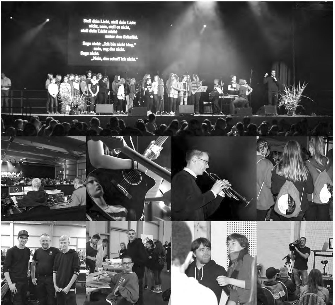
Mehr als 700 Schülerinnen und Schüler trafen sich am 2. Oktober 2019 in der Messehalle Löbau

Passend zum Motto des Tages nahmen Schüler aller Schulen an einem Logowettbewerb teil.