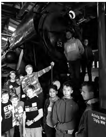
Eisenbahnfreunde. Im Maschinenhaus der Eisenbahnfreunde Löbau erfuhren die Schüler alles über die Loks. Höhepunkt war eine Ausfahrt.