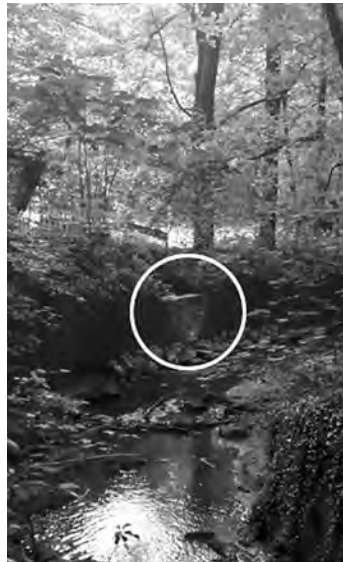
Auslauf des Regenwasserkanales in den Petersbach

Parallel zum Kanalbau erfolgten die Arbeiten für den Straßenbau und Verlegung des Straßenbeleuchtungskabels.