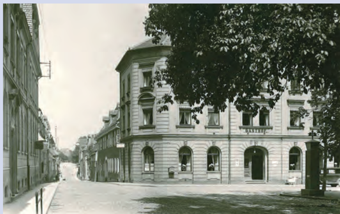
Am Platz mit Gasthof (1945 abgebrannt) und Löbauer Straße, um 1910