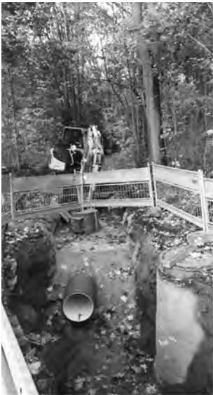
Kanalverlegung im 1. TA

Bei Verlegung des Regenwasserkanales kam es zu massiven Behinderungen durch den felsigen Untergrund.