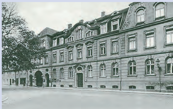
Neues Brüderhaus, 1945 abgebrannt