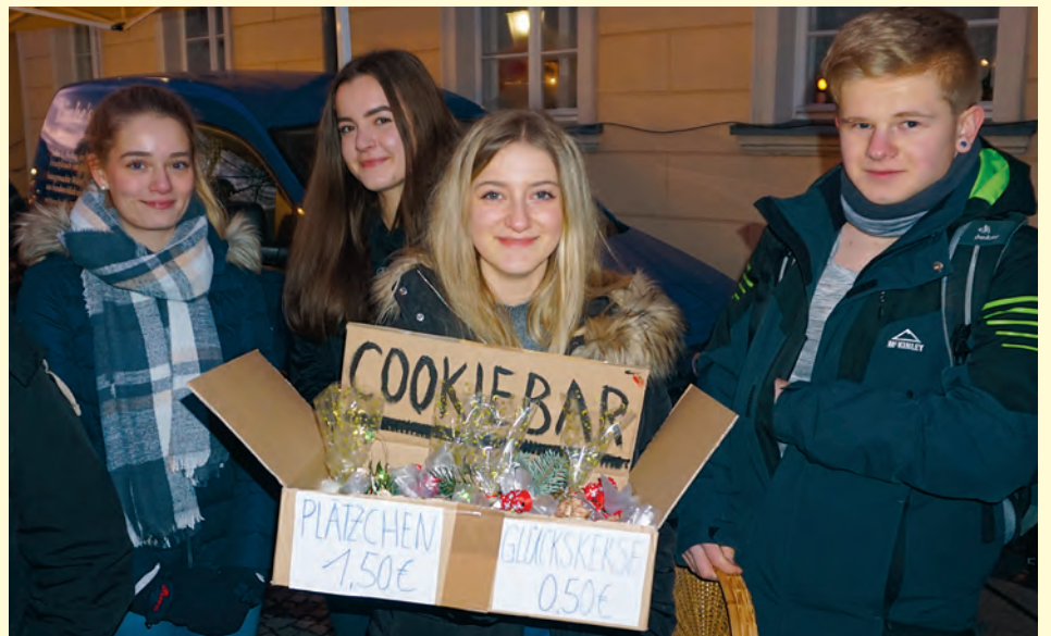
Auf dem Herrnhuter Weihnachtsmarkt am 30. November 2019