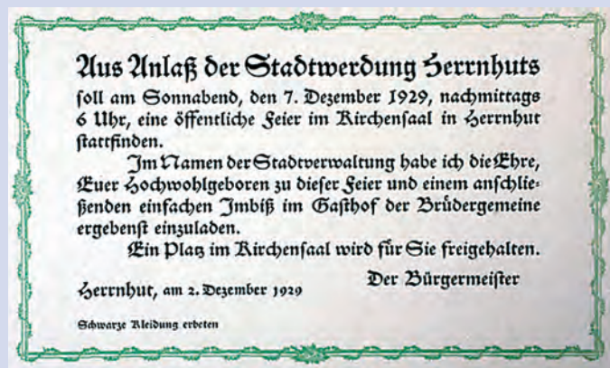
Einladung für die Feier der Stadtwerdung Unitätsarchiv Herrnhut, Mappe D2, 20.2