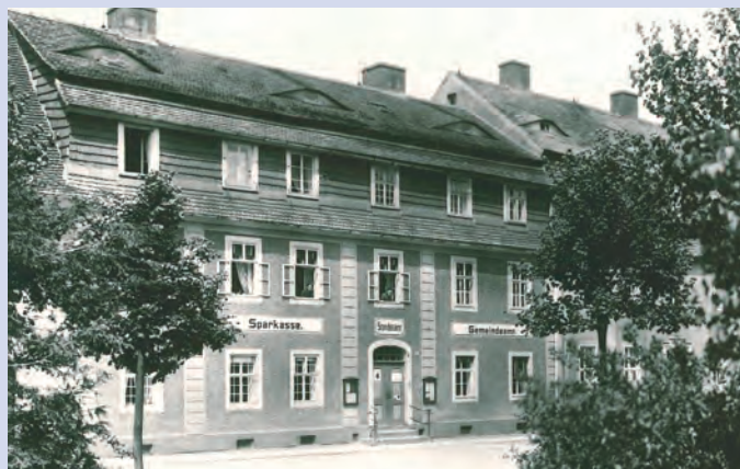
Altes Gemeindeamt am Zinzendorfplatz