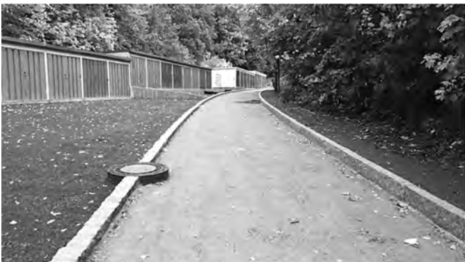
Vorbereitungen für den Asphaltbau

Parallel zum Kanalbau erfolgten die Arbeiten für den Straßenbau und Verlegung des Straßenbeleuchtungskabels.