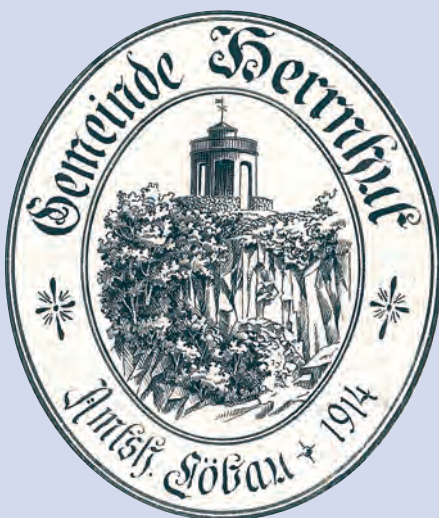
Siegel der Gemeinde Herrnhut bis 1930