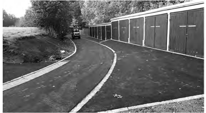
Fertigstellung des 2. TA

Am 30.9. bis 2.10.2019 wurde im Bereich von Christian-David-Straße bis zu den Garagen (2. TA) die Asphaltdecke und vom 14. bis 15.11.2019 wurde auf dem Radweg zum Petersbach (1. TA) der Asphalt eingebaut und die Fahrbahndecke somit fertiggestellt.