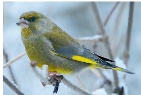
Eines der Sorgenkinder bei der »Stunde der Wintervögel«: Der Abwärtstrend beim Grünfink setzt sich auch 2020 fort.

Etwas geringer als erwartet machte sich die Eichelhäher-Invasion des vergangenen Herbstes bemerkbar. Zwar konnte in 4,6 von zehn Gärten ein Eichelhäher beobachtet werden, doch erreichte er nicht den bisherigen Topwert von 1,25 pro Garten im Jahr 2011. Damals war der Winter allerdings deutlich härter. Es ist anzunehmen, dass ein großer Teil der Eichelhäher in diesem Winter nicht aus den Wäldern in die Gärten gekommen ist.