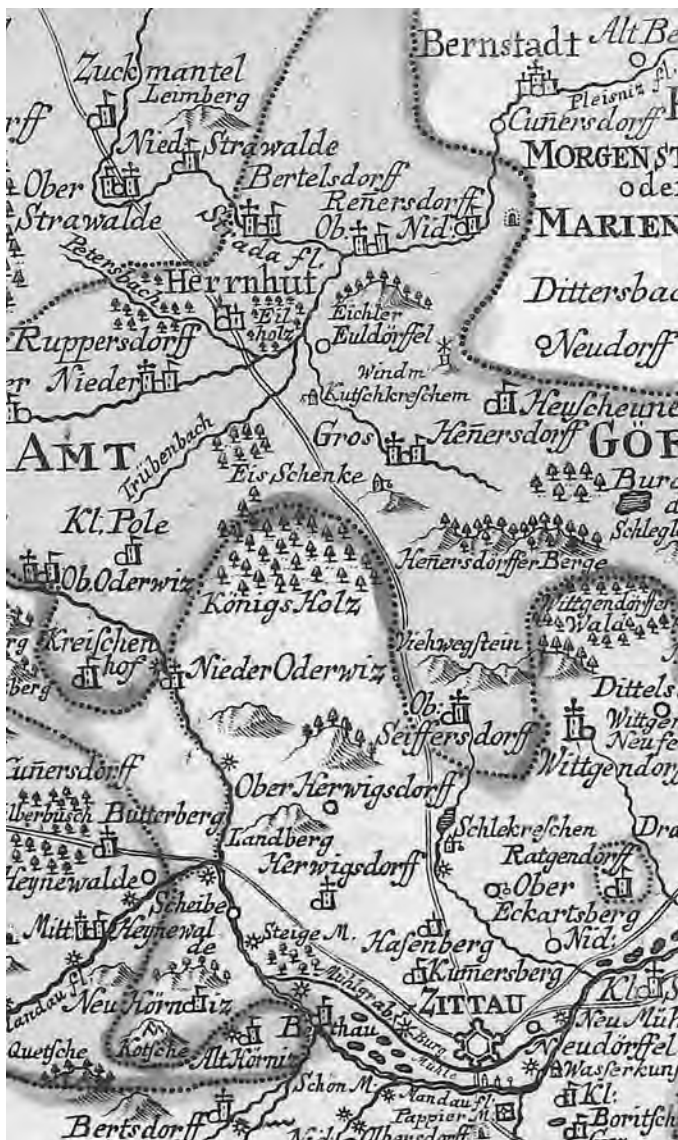
»Territorium der churfürstlichen Sechsstadt Zittau in der Oberlausitz mit den benachbarten hochadligen Herrschaften und Rittergütern wie auch den Hauptstraßen« (Ausschnitt) Inv. HMH 13161 | kolorierter Kupferstich | Zeichner: Johann Daniel de Montalegre

Auf einer der ersten Oberlausitz-Karten überhaupt ist hier das 1722 gegründete Herrnhut verzeichnet. Sehr herzlich danken wir den Archiven, Bibliotheken und Museen in Görlitz, Löbau und Zittau sowie dem Berthelsdorfer Zinzendorf-Schloss, welche durch großzügige Leihgaben diese Ausstellung überhaupt erst ermöglicht haben. Ebenso dankbar sind wir über die Unterstützung des Herrnhuter Unitätsarchives. Aus dessen Sammlung sind drei