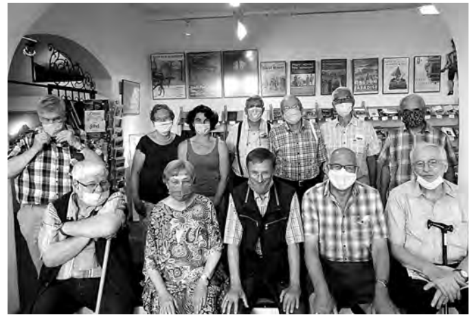
Unsere Gruppe wartet auf die Befreiung aus dem Museum

Der Abend klang dann bei einem gemütlichen Abendbrot im lauschigen Biergarten des Klosterstübels aus.