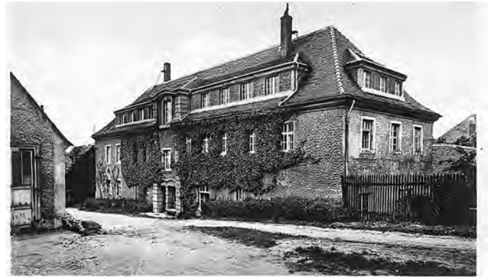
Herrnhut Theol. Seminar

Neben dem eigentlichen Lernen hatten die Studenten am Herrnhuter Predigerseminar aber immer wieder auch Zeit für manchen Ulk. Höhepunkt war der von Studenten inszenierte, vorgebliche Besuch von Ludidi Amabaka III. (Sohn des Umtata von Hlubiland, heutiges Südafrika) am 25.2.1938 in Herrnhut. Dieser Fastnachtsulk war natürlich von vorn bis hinten frei erfunden. Da der Besuch vorher aber sogar an die Lokalpresse lanciert wurde, erwartete den »König von Umtata« bereits am Bahnhof eine große Menschenmenge.