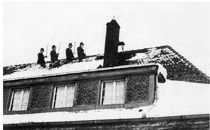
Mitglieder des Spazierstockvereins auf dem Seminardach (um 1940, HMH 12373)

Aus dieser Zeit ist auch die Gründung eines »Spazierstockvereins« am Seminar überliefert. Ein historisches Foto zeigt einige Mitglieder auf dem Dachfirst des Hauses.