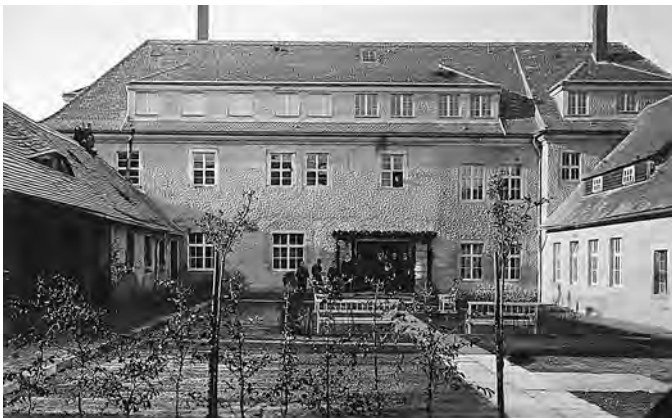
Hof des Theologischen Seminars (um 1925, HMH 8475)

Ab 1919 erfolgten umfangreiche Umbauarbeiten, ehe am 19.10.1920 – also vor fast genau 100 Jahren – das Theologische Seminar/Predigerseminar der Brüdergemeinde aus dem ober-schlesischen Gnadenfeld nach Herrnhut zog.