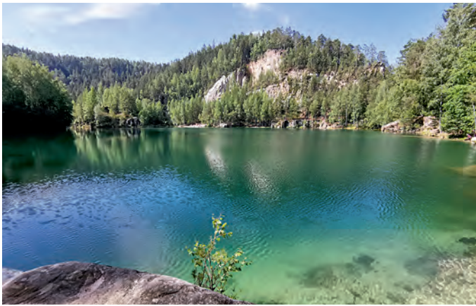
Der See in der ehemaligen Kiesgrube