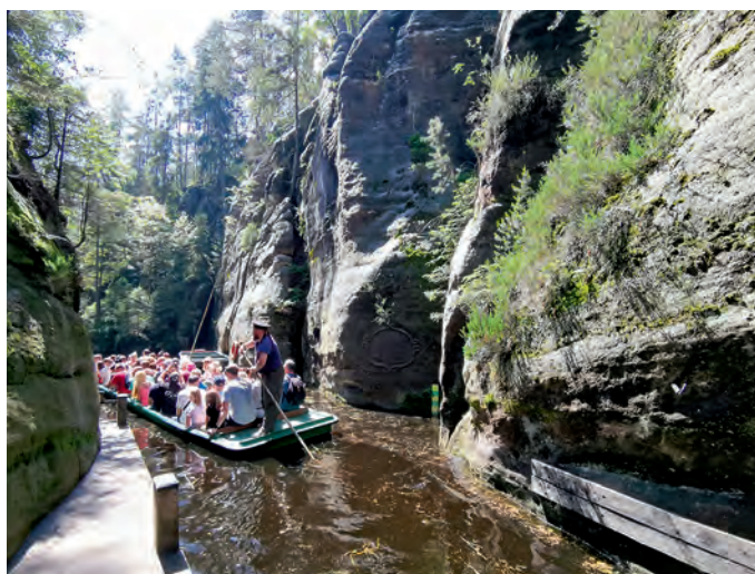
Kahnfahrt auf dem Stausee