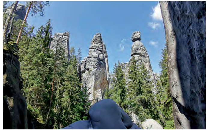
Bürgermeister und Bürgermeisterin

Einige der bekanntesten Felsformationen sind: die Felsenstadt, der Zuckerhut, das Liebespaar, der Gerichtsplatz mit Bürgermeister und Bürgermeisterin.