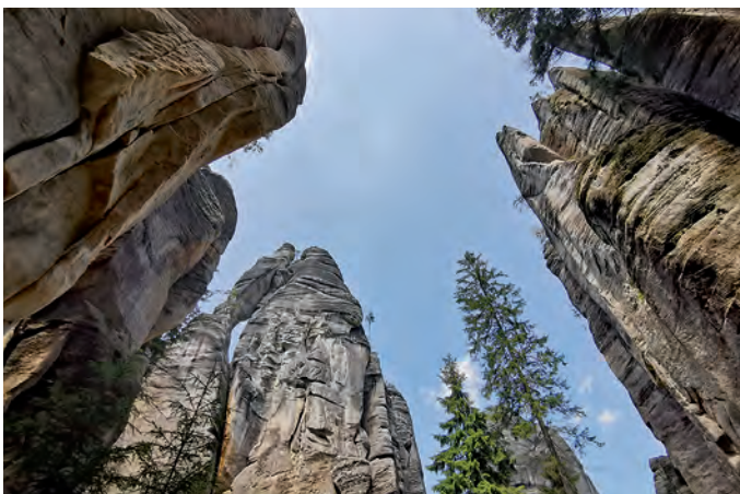
Das Liebespaar (links neben den Bäumen)

An dieser Stelle muss ich natürlich auch darauf hinweisen, dass es hier nicht nur die Adersbacher Felsenstadt gibt, sondern sich gleich daneben, nur durch die Johnsdorfer Wolfsschlucht getrennt, auch noch die Weckelsdorfer Felsenstadt (Teplické skály) befindet, beides Felsformationen aus Sandstein.