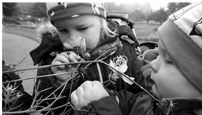
Mit freundlichen Grüßen