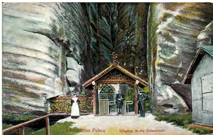
Postkarte, um 1900

»Adersbach wird merkwürdig durch eine ungeheure Reihe einzeln stehender Felsen, die sich über drei Meilen weit erstrecken, und auf eine so außerordentliche Art durcheinander geworfen, und voneinander getrennt worden sind, wie ich sie nirgends sah.«