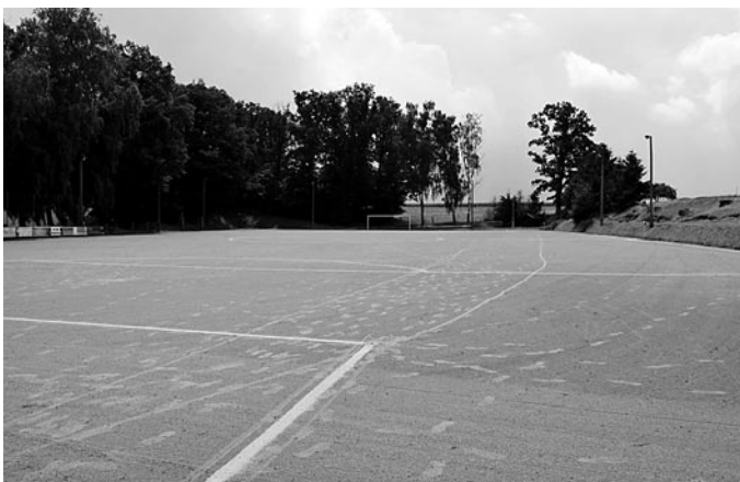
Bestes Fußballwetter vor Beginn des Pokalspiels am Sonnabend.

Regen ein. Nach weiteren fünf Minuten unterbrach der Schiedsrichter beim Stand von 0:0 auf Wunsch des Gegners das Spiel. Klatschnass flüchteten die Spieler in die Kabinen. Auch die Zuschauer nutzen alle möglichen Unterstände oder ihre Autos als Regenschutz.