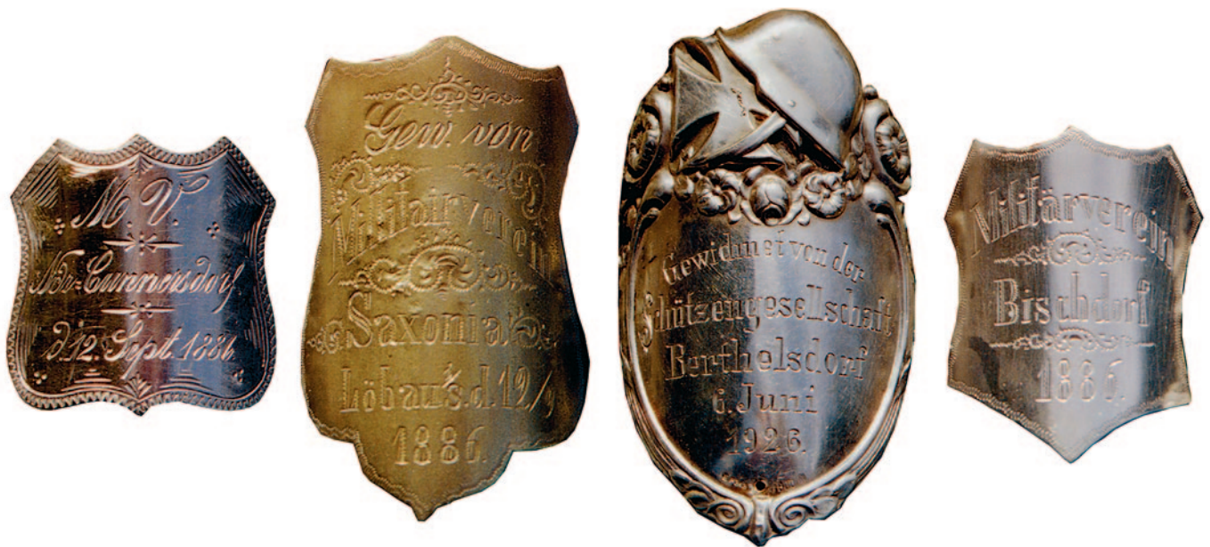
Wie für einen Spazierstock gibt es auch für Fahnenstangen Stocknägeln, die man bei anderen Vereinen oder zu besonderen Anlässen erwerben kann. Die Berthelsdorfer Schützengesellschaft hat eine alte sehr schöne Fahnenstange mit entsprechenden Stocknägeln. Diese Nägel sind bei anderen Vereinen ein heiß begehrtes Sammlerobjekt, was man aber natürlich nur benutzen darf, wenn eine Vereinsbeziehung dazu besteht.