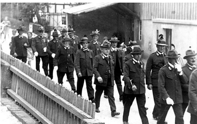
Berthelsdorfer Schützenverein vor 1933

Der Schützenverein Berthelsdorf ist als Scheibenschützenverein am 1.6.1851 gegründet worden. Diesem Verein gehörten Personen aus Berthelsdorf, Herrnhut und Rennersdorf an, welche aus allen Schichten der Bevölkerung kamen. Eine Uniformierung wurde um 1862 eingeführt. Eine Brauchtumpflege und Wahrung von Traditionen wurden teilweise vom Militär übernommen. Ab 1939 wurde Vereinsarbeit bis 1945 untersagt, da die Männer für die Armee gebraucht wurden. Nach 1945 durften keine Privatpersonen Waffen besitzen, es passte nicht zum Sozialismus, obwohl bei KVP (Kasernierte Volkspolizei) oder GST (Gesellschaft für Sport und Technik) fleißig geschossen wurde.