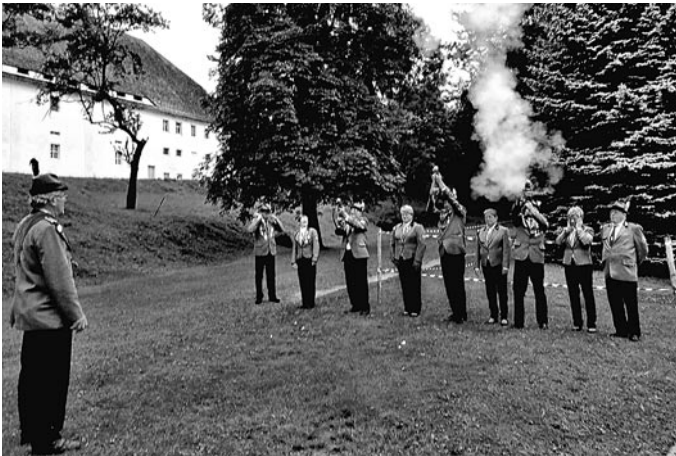
Schützenverein beim Böllerschießen bei der 700-Jahr-Feier in Berthelsdorf am 13.8.2017

Der Schützenverein Berthelsdorf ist als Scheibenschützenverein am 1.6.1851 gegründet worden. Diesem Verein gehörten Personen aus Berthelsdorf, Herrnhut und Rennersdorf an, welche aus allen Schichten der Bevölkerung kamen. Eine Uniformierung wurde um 1862 eingeführt. Eine Brauchtumpflege und Wahrung von Traditionen wurden teilweise vom Militär übernommen. Ab 1939 wurde Vereinsarbeit bis 1945 untersagt, da die Männer für die Armee gebraucht wurden. Nach 1945 durften keine Privatpersonen Waffen besitzen, es passte nicht zum Sozialismus, obwohl bei KVP (Kasernierte Volkspolizei) oder GST (Gesellschaft für Sport und Technik) fleißig geschossen wurde.