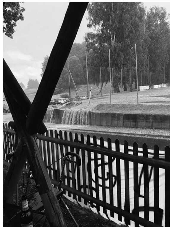
Die Drainage kann das Wasser des Starkregens nicht mehr fassen.

Zunächst trat am Sonnabend Nachmittag um 15.00 Uhr unsere 1. Männermannschaft im Pokalachtelfinale gegen die höherklassige Kreisoberliga-Mannschaft vom SV Neueibau an. Bis zum Anpfiff war nichts vom bevorstehenden Wolkenbruch zu sehen. Doch schon eine Viertelstunde nach Spielbeginn setzte starker