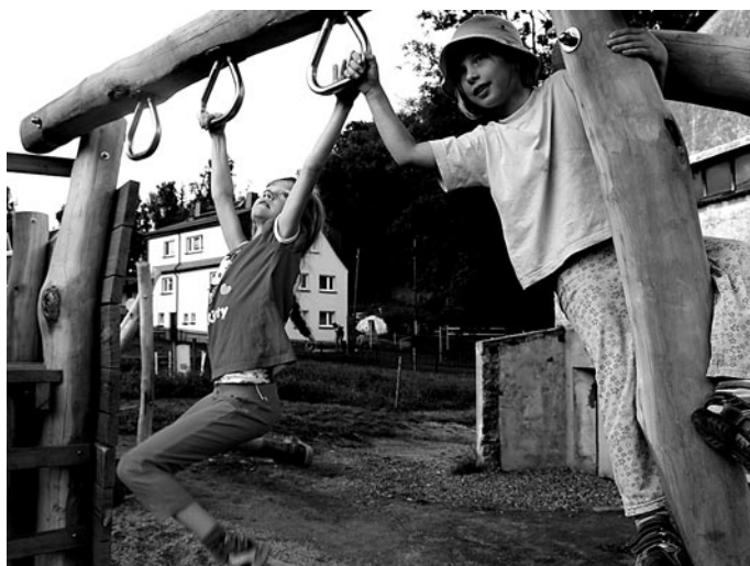
Mit einem neuen Natur-Spielplatz punktet die Zethauer Freizeitstätte »Grüne Schule grenzenlos«. Der anspruchsvolle Parcours wird sicher auch für die Ferienkinder in den Sommerferien ein beliebter Treff und Anziehungspunkt sein.