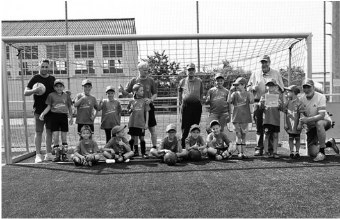
Vorstand des HSV 90 e.V.

Vom Landkreis Görlitz erhielt unser Verein eine Unterstützung für das Ehrenamt mit einem symbolischen Scheck von 200,00 €, den wir in sogenannte »Mutmacher-T-Shirts« für unsere Nachwuchskicker investierten. Zum Training wurden die T-Shirts überreicht. Zur Freude gab es noch jeweils ein Basecape dazu, welches von der Firma Abraham Dürninger & Co. GmbH gesponsert wurde. Herzlichen Dank dafür!