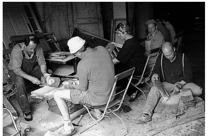
Vereinshilfe in der Praxis – Schützen beim Dachziegelreinigen im Zinzendorf-Schloss am 23.6.2004

Als Schützengesellschaft sind wir auch in anderen Orten mit Einladung gern gesehen. (z.B. in Niedercunnersdorf, Neusalza-Spremberg, Friedersdorf und Neugersdorf). Unser Aufzug ist natürlich mit Vereinsfahne, die eine Fahnenstange aus der Gründungszeit besitzt. Sie wurde vom Militärverein übernommen.