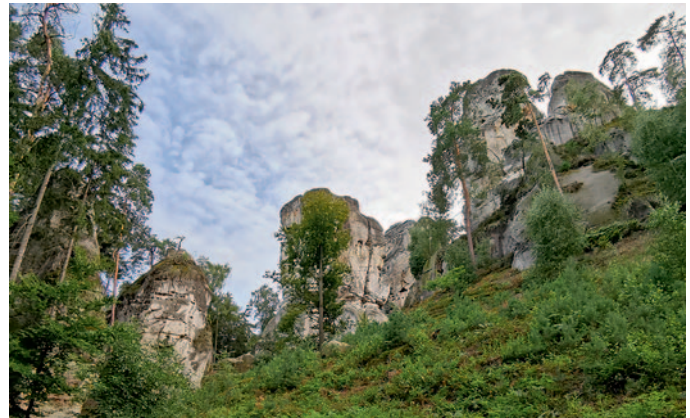
Felsenlandschaft auf dem Rückweg

Bevor es wieder zum Parkplatz geht, kann man die Gelegenheit nutzen und im Schlossrestaurant zu Abend speisen und bei schönem Wetter auch gleichzeitig die fabelhafte Aussicht auf der Restaurantterrasse genießen.