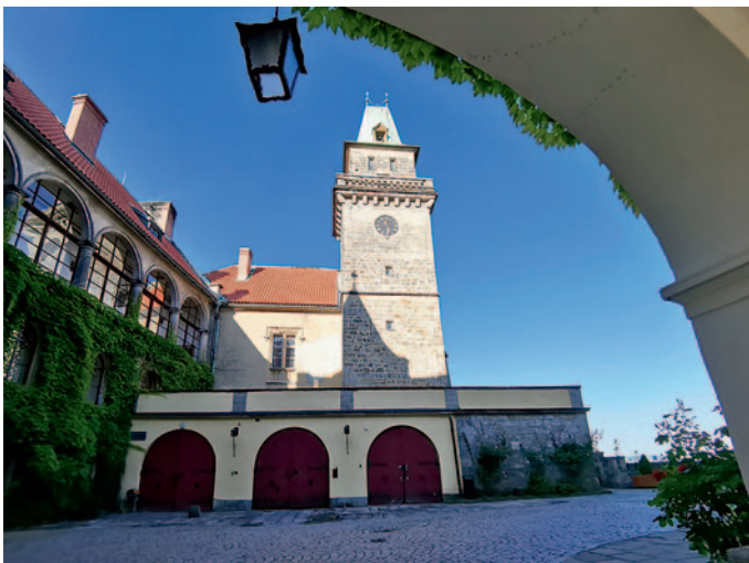
Schlosseingang und Innenhof

Das Renaissanceschloss Hrubá Skála wurde auf zwei Sandsteinfelsen ca. 60 Meter über dem Tal an der Stelle einer mittelalterlichen Burg aus dem 14. Jahrhundert errichtet. 1804 legte man hier einen englischen Garten an und 1859 wurde das Schloss im neogotischen Stil umgebaut. In mehreren Jahrhunderten gehörte es der Herrschaft von Wallenstein (Waldstein).