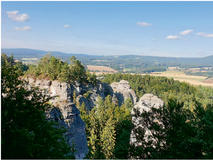
Blick in die Felsenstadt

Im letzten »kontakt« habe ich den ersten Teil unserer Rundwanderung in der Felsenstadt Hruboskalsko bis zur Burg Wallenstein vorgestellt. Wir gehen nun einen gemächlichen Weg zum Schloss Hrubá Skála. Unterwegs hat man einige schöne Ausblicke nach Sedmihorky, in die Felsenstadt und zur Burg Trosky.