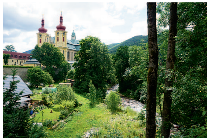
Kloster mit der Wittig

Seit 1991 wurde auch die Wallfahrt Anfang Juli zum Festtag »Maria Heimsuchung« wieder belebt.