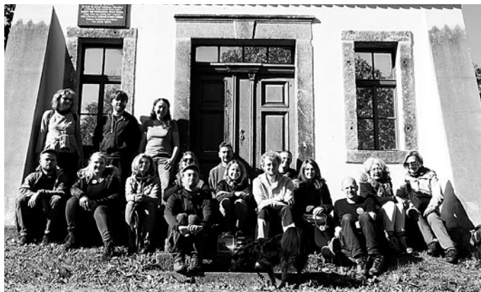
Gruppenfoto der Teilnehmer »Vergessene Orte« 2022

Hiermit möchten wir Sie zu einer besonderen Wanderung einladen.