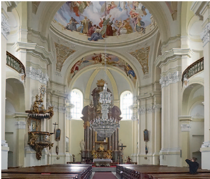
Das Innere der Wallfahrtskirche

Hier in Haindorf an der Wittig verbinden sich alte Pilgerwege aus der Reichenberger und Friedländer Gegend, aus Schlesien, der Lausitz und Böhmen. 1725 wurde hier ein Franziskanerkloster errichtet und diese Barockkirche gebaut. Dieser Wallfahrtsort geht aber auf eine viel frühere Legende zurück.