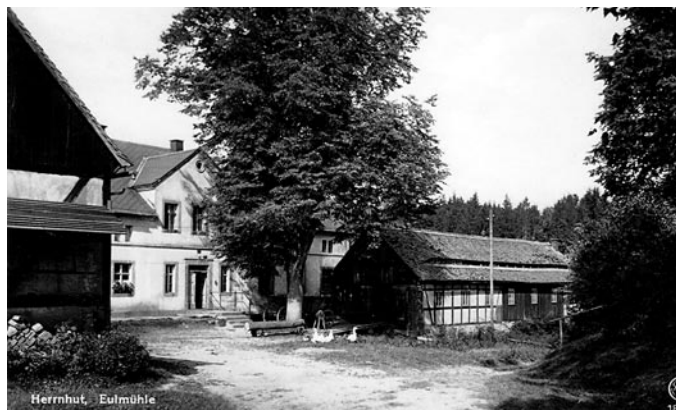
Eulmühle · Fotoquelle: Heimatmuseum Herrnhut

Die Wanderung ist eine gemeinsame Einladung der Gruppe »Grohedo aktiv« und des Projektes »Vergessene Orte«. Das deutsch-tschechische Projekt findet einmal jährlich statt und beschäftigt sich mit der Historie unserer Region. Diesmal haben sich die sechzehn Teilnehmenden mit dem ehemaligen Gasthaus »Batzenhütte« und der »Eulmühle« beschäftigt. Dabei wurden historische Fotoaufnahmen zusammengetragen, Quellenmaterial gesichtet und Interviews geführt, schlussendlich entstanden vier kurze Filme, welche nun an die Orte, aber auch an Personen erinnern. Diese Filme werden zur Wanderung vorgestellt und sind langfristig via QR-Code vor Ort abrufbar. Im Anschluss an die Wanderung (ca. 16.00/16.30 Uhr) erwartet alle an der Eulmühle ein kleiner Imbiss.