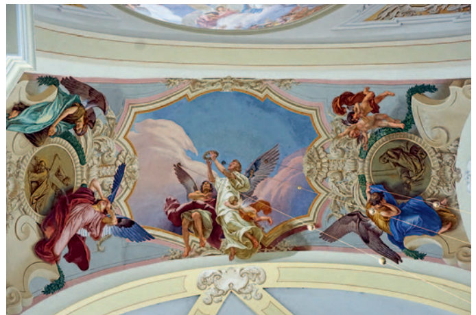
Deckengemälde in der Kirche

Zuerst wurde an dieser Stelle eine hölzerne Kapelle errichtet, 1472 dann eine größere gotische Kirche. Nach dem Bau der barocken Kirche mit dem Franziskanerkloster wurde Haindorf ein bedeutender Wallfahrtsort bis in das 20. Jahrhundert. Nach dem Zweiten Weltkrieg und der damit verbundenen Vertreibung der meisten Deutschen aus Böhmen kam die Wallfahrt vollständig zum Erliegen. Das Kloster mit der Kirche verfiel langsam. Nach der politischen Wende 1989 endlich konnte das Kloster mit Spenden und EU-Geldern wieder restauriert werden. Das Kloster wurde nun zum »Internationalen Zentrum der geistlichen Erneuerung«.