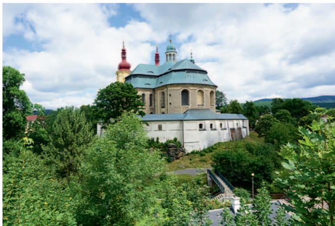
Am markierten Rundweg um den Klosterkomplex

Nach der Besichtigung der Wallfahrtskirche sollte man auch unbedingt den kleinen Rundweg um das Kloster gehen. Am besten, linker Hand, wenn man aus der Kirche austritt, am Parkplatz vorbei, über die kleine Brücke über die Wittig und dann einfach am Flusslauf der Wittig um den Klosterkomplex herum (nach der Brücke den mit einem roten, blauen und grünen Strich gekennzeichneten Weg, die Stufen links hinunter).