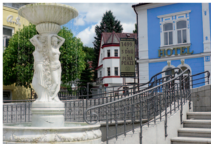
Brunnen in der Kuranlage

Vom Zentrum nochmal knapp fünf Minuten entfernt ist dann das sicher allseits bekannte Riesenfass mit Gaststätte.