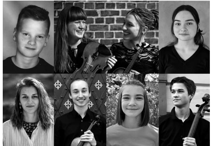
Akademisten der KMO-Akademie 2022