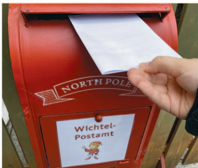
245 Wichtel-Briefe wurden zum Handwerkermarkt im Wichtelpostamt eingeworfen.