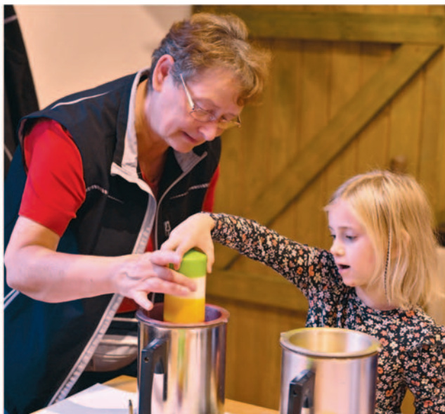
Kerzen tauchen und verzieren – darin konnten sich die Gäste ausprobieren. Auch das Aussägen und Bemalen von Holzsternen, angeboten von der Herrnhuter Holzmanufaktur, wurde begeistert angenommen.