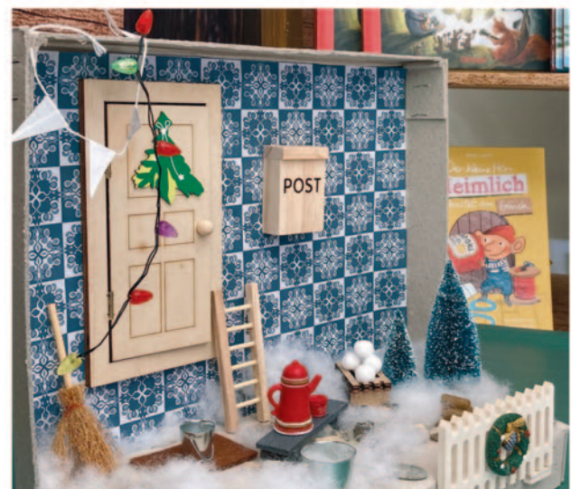
Hinter solch einer Mini-Wichteltür wohnen die Hauswichtel im Advent.