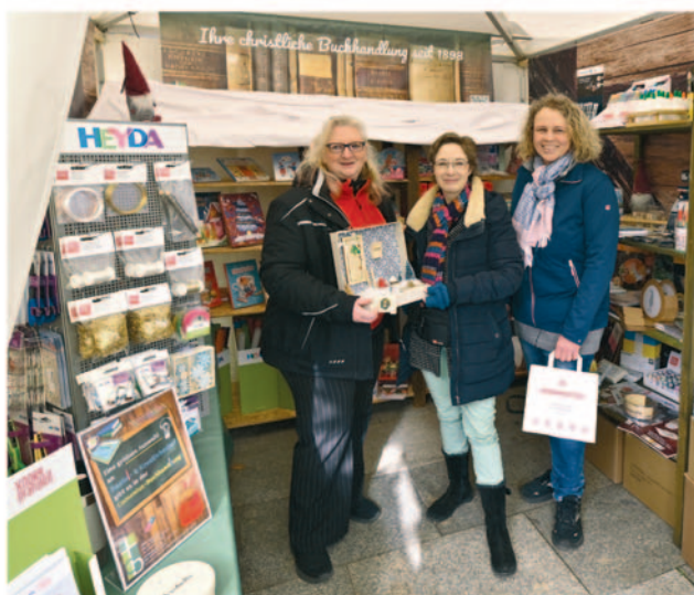
Die Comenius-Buchhandlung bot zum Handwerkermarkt u. a. Wichtel-Zubehör an.